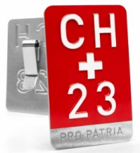
Insigne Pro Patria